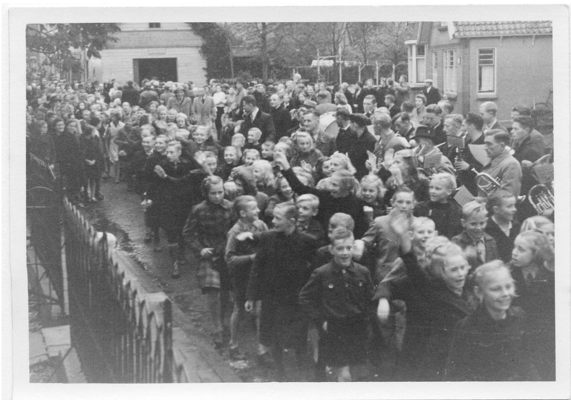
Een groep schoolkinderen: eerst de jongens