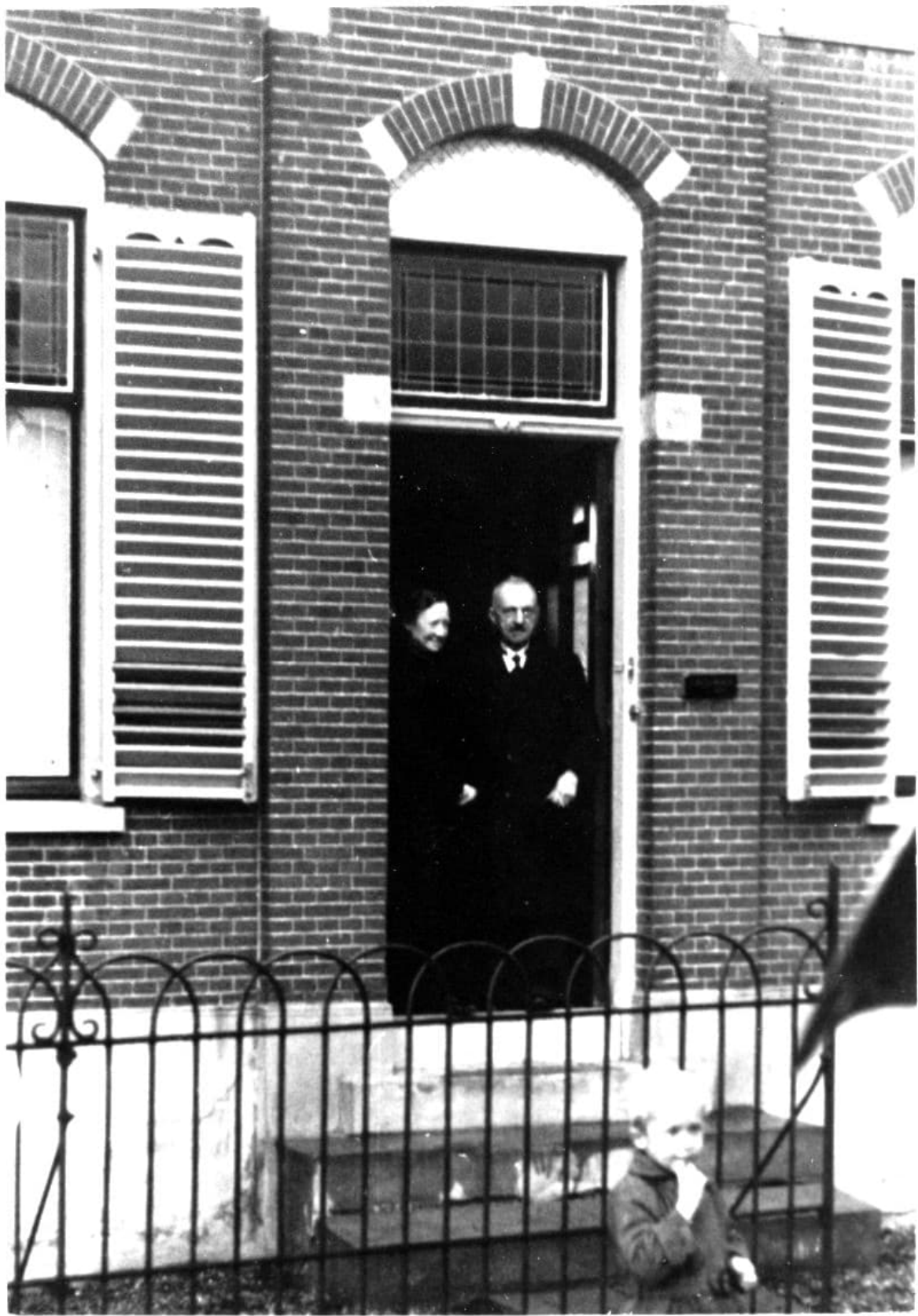
Niets vermoedend verscheen het artsenechtpaar in de deuropening.