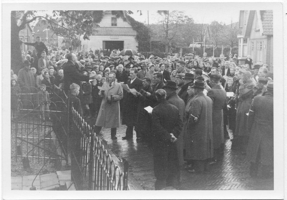
Katholieke mannen zongen een Latijns lied. De mannen met een bandje om hun bovenarm waren betrokken bij de organisatie.