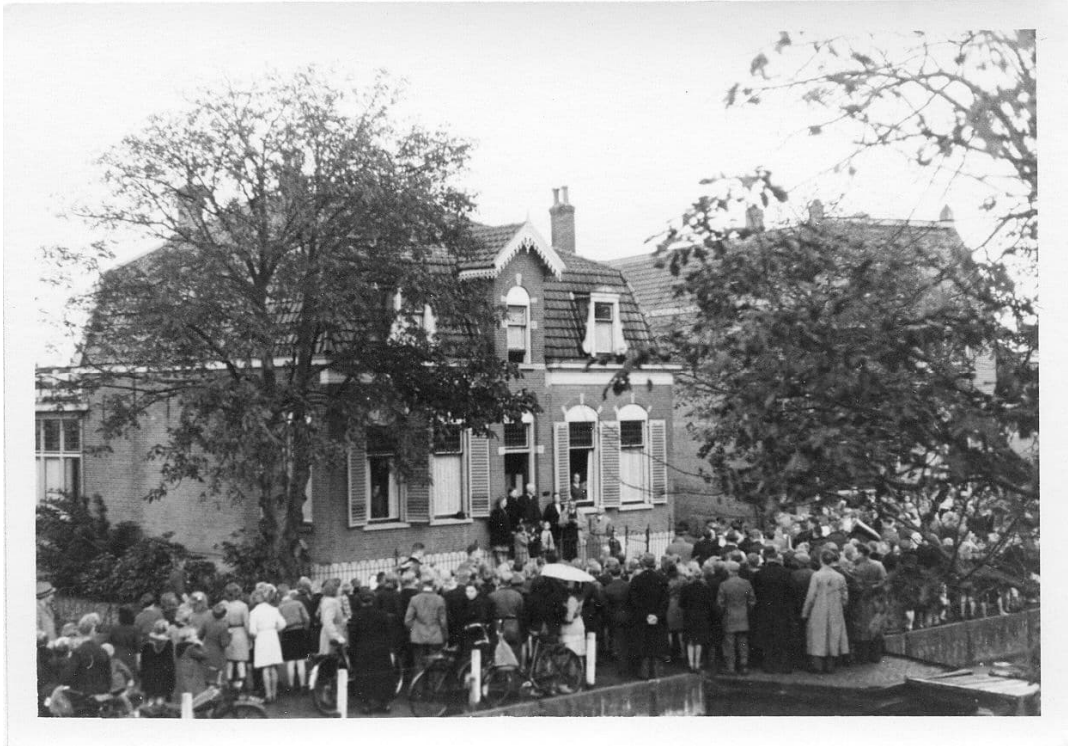
Tot slot een overzicht met het doktershuis, geflankeerd door kastanjabomen. Op de voorgrond de draaibrug van Piet Oosthoek.