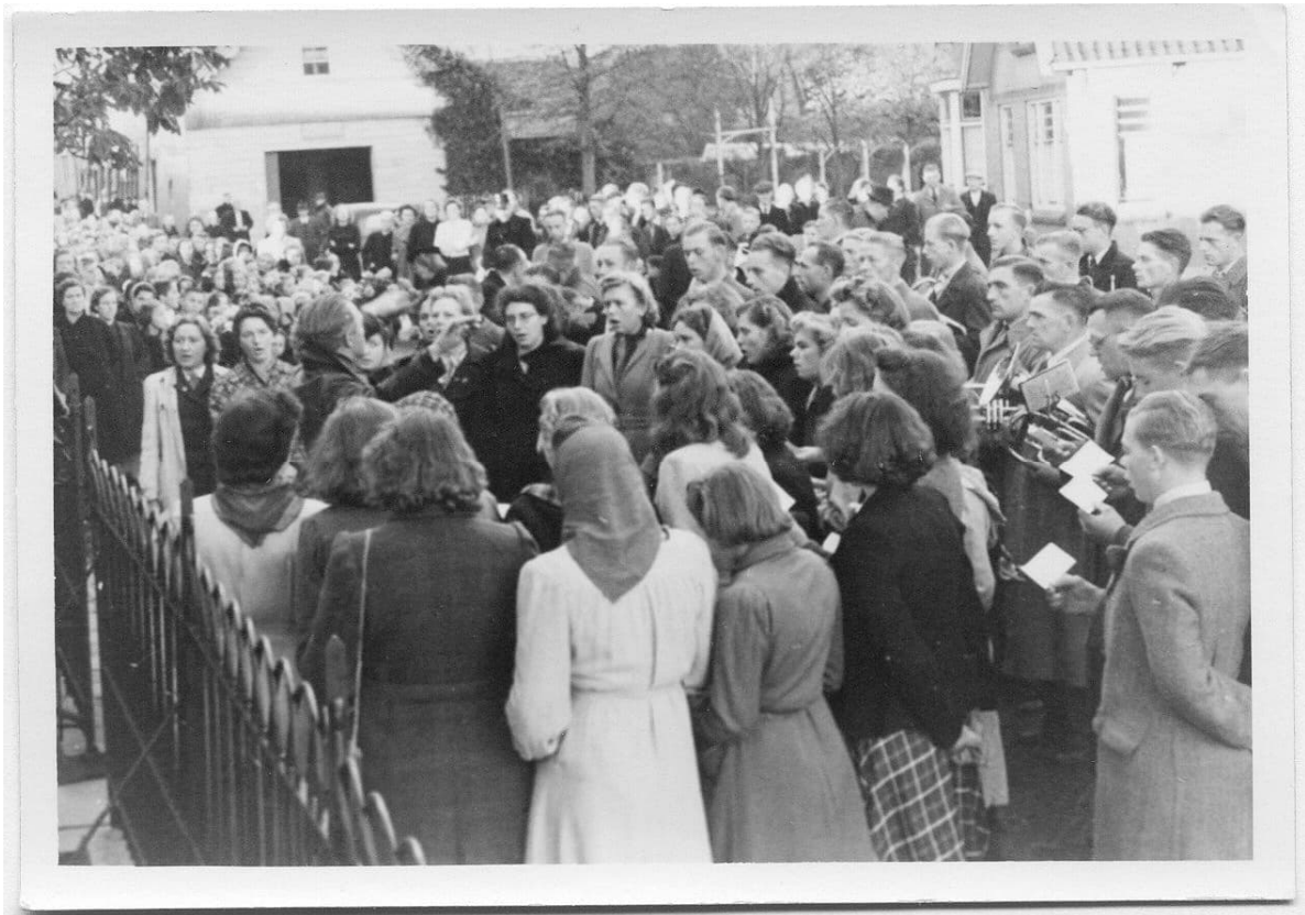
Aubade door de dames van het koor Vlijt en Volharding.