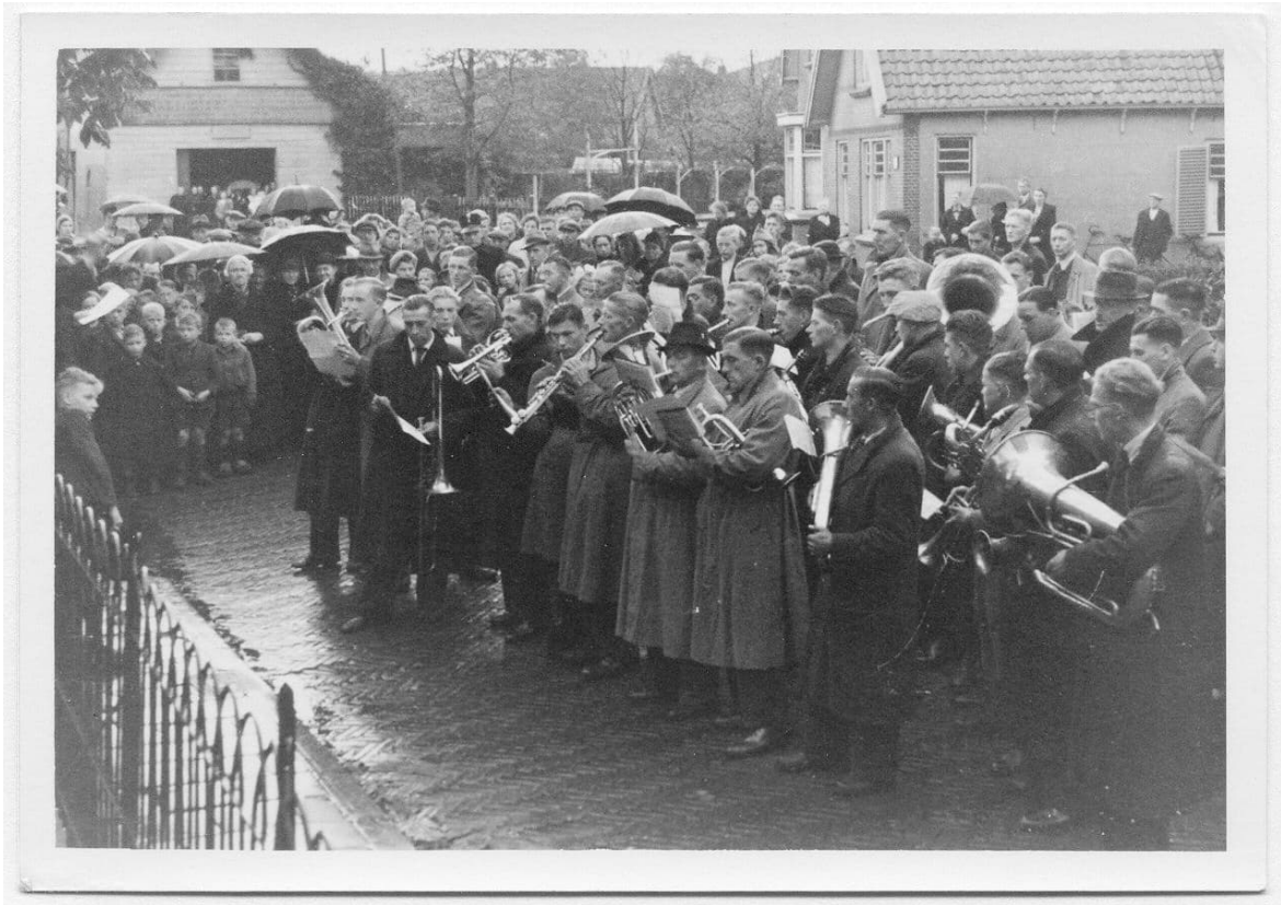
Fanfare Corps Concordia.