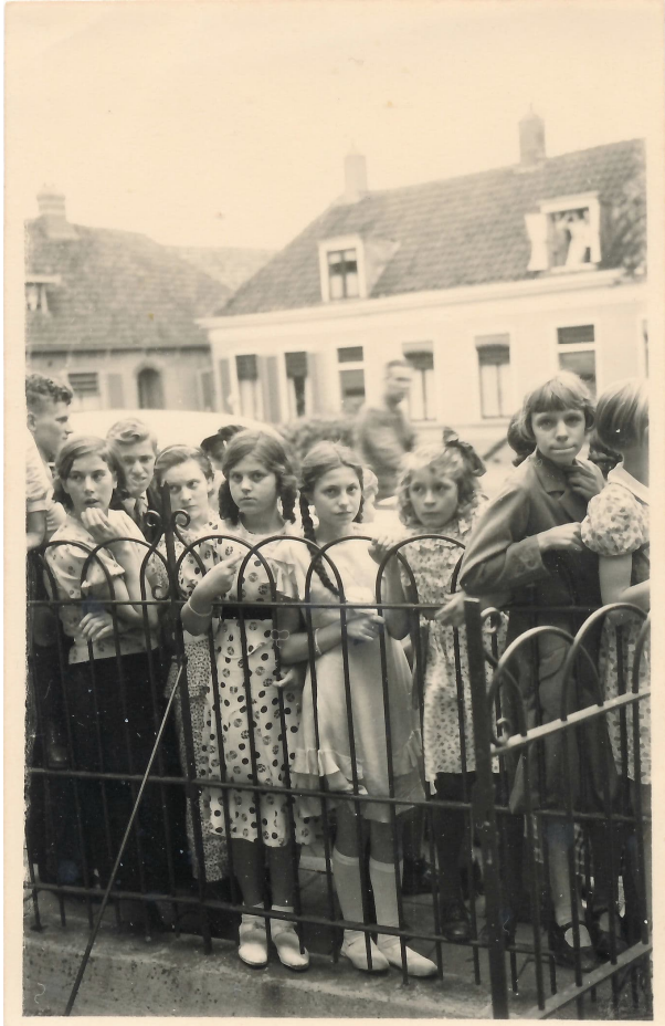
Dan de meisjes