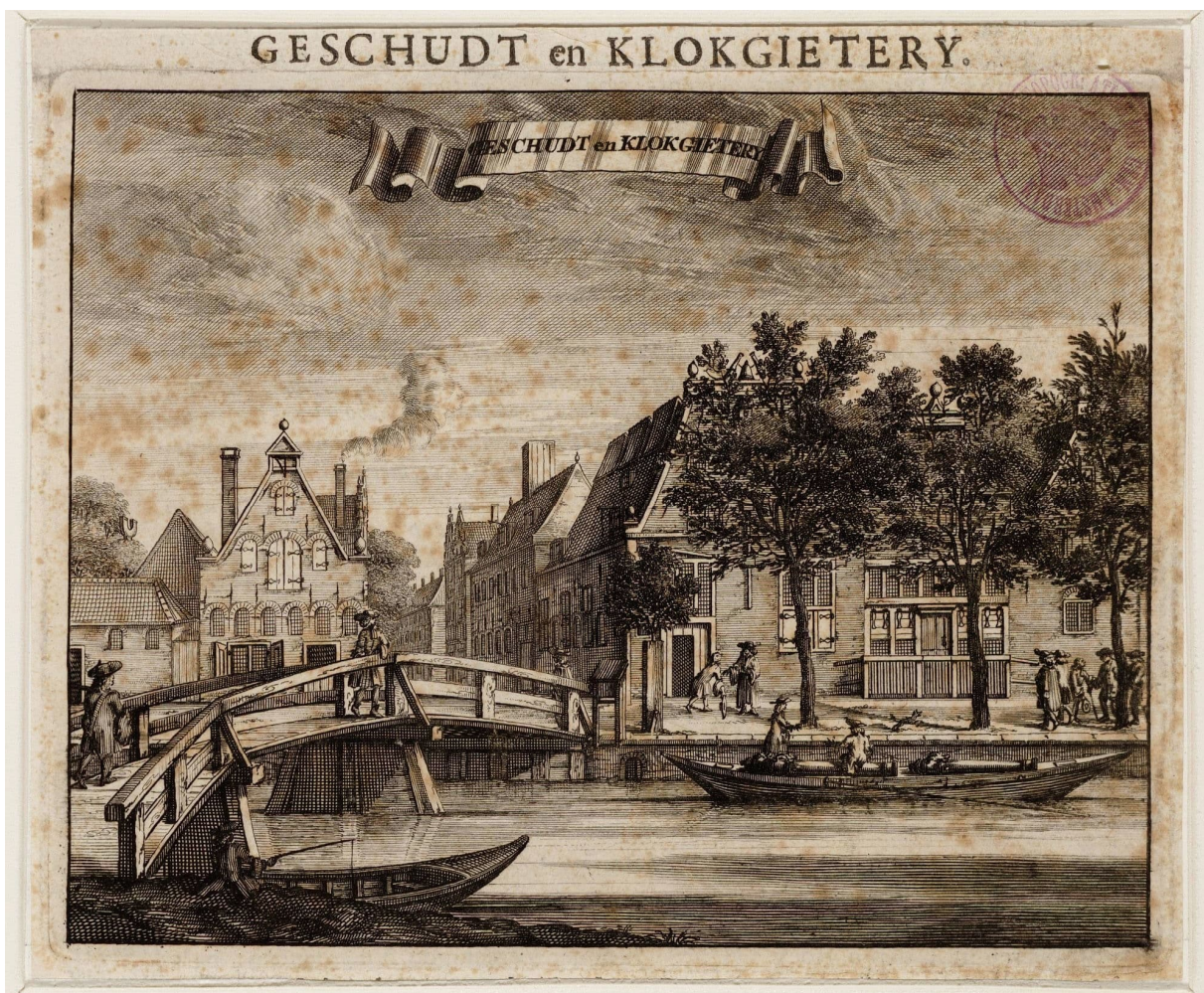
De Lijnbaansgracht in 1693 met achter de bomen de klokkengieterij