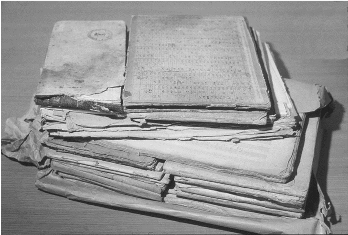
De verzameling muziekboekjes in het stadsarchief van Delft