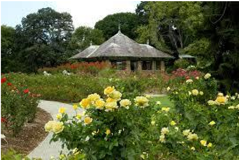
Sydney – Botanical Gardens wikipedia

Donderdag 13 april bezochten we op uitnodiging van de directeur het Conservatorium voor Muziek. Dit is uitstekend geoutilleerd. Met één van de pianostemmers van het conservatorium had ik een interessante discussie over de verschillende stemmingen. Hij bleek zeer goed op de hoogte van andere stemmingen dan alleen de evenredig zwevende. 's Middags waren we 'vrij'. We brachten een bezoek aan de Botanical Gardens. Dat is een hobby van mij, foto's maken van exotische bloemen.