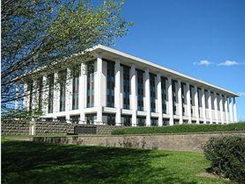
Canberra – National Library