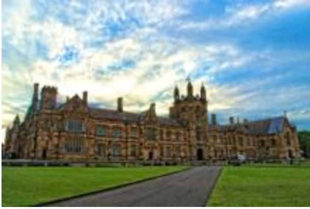
De binnenplaats van Sydney University In het midden de carillontoren.