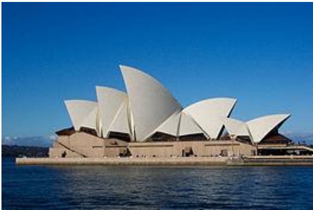
Sydney Opera House - wikipedia

was bestemd voor sightseeing; we bezochten onder andere het geweldige Opera House, een waar landmark als je Sydney via het water benadert.