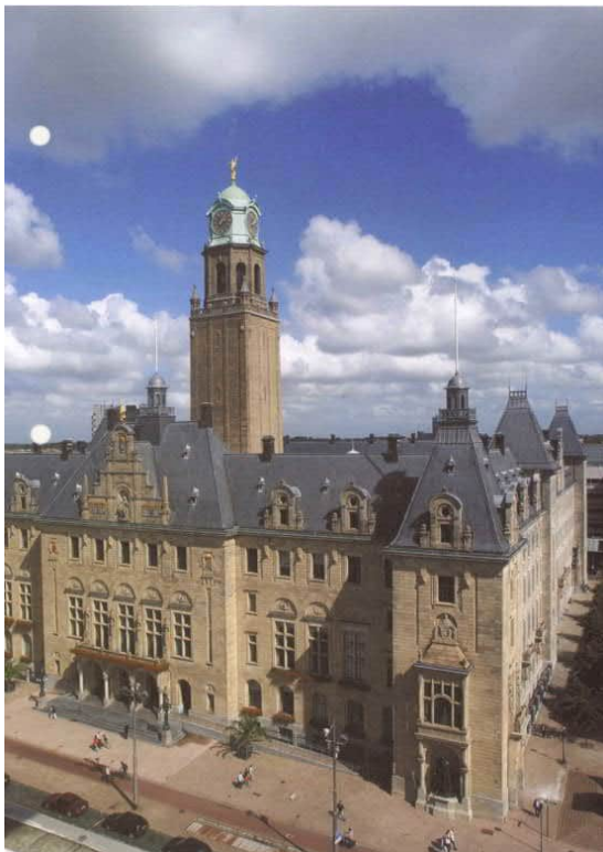
Het stadhuis aan de Coolingsingel