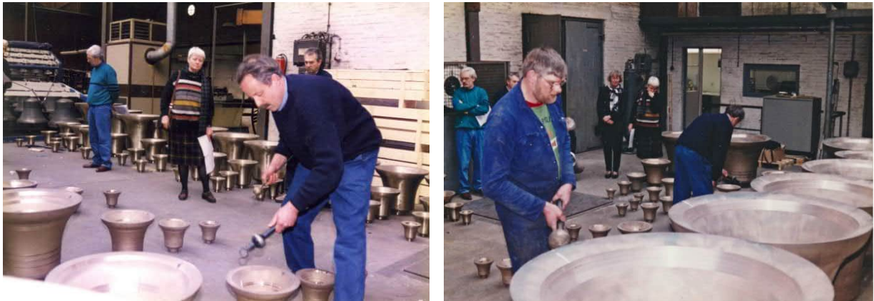
Keuren van de schoongemaakte en gestemde klokken bij Petit & Fritsen in Aarle-Rixtel

werd in februari een stemplan opgesteld. De reeksen uit 1948 en 1975 moesten zoveel mogelijk naar elkaar toegestemd worden. Medio maart vond de keuring plaats in de klokkengieterij en kon de commissie constateren dat het beoogde resultaat inderdaad was bereikt.