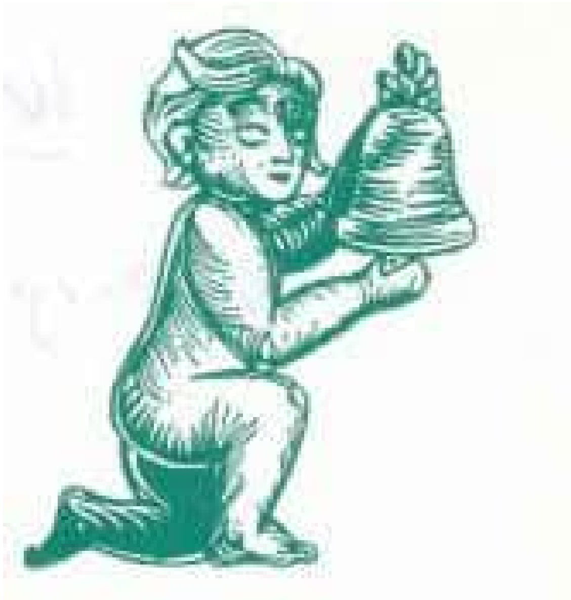
Logo van de Rotterdamse Beiaard Commissie. Ontleend aan een Hemonyklok uit 1660.