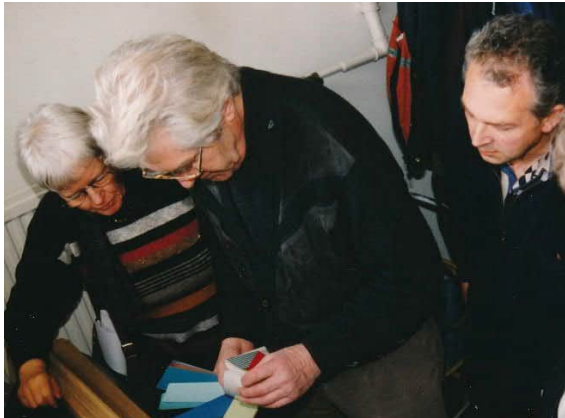
Kleur keuze voor het klavier

Ik had het al over de akoestische aspecten, ook visuele details kregen de aandacht. Voor zover de klokken door de acht torenvensters zichtbaar zijn vanaf de straat, worden ze bovendien 's avonds door schijnwerpers belicht. De wanden van de nieuwe speelcabine zijn geheel in glas uitgevoerd. Het klavier is zodanig opgesteld dat de beiaardier aan de Coolsingel vanaf de straat zichtbaar is. Het klavier is in een ambachtelijke stijl in eikenhout uitgevoerd. Boven de lessenaar is een Latijnse spreuk aangebracht, die in de 17e eeuw veel werd gebruikt op clavecimbel: 'Musica laetitiae comes medicina dolorum' ofwel 'Muziek is de begeleider van blijdschap en medicijn bij smarten.'