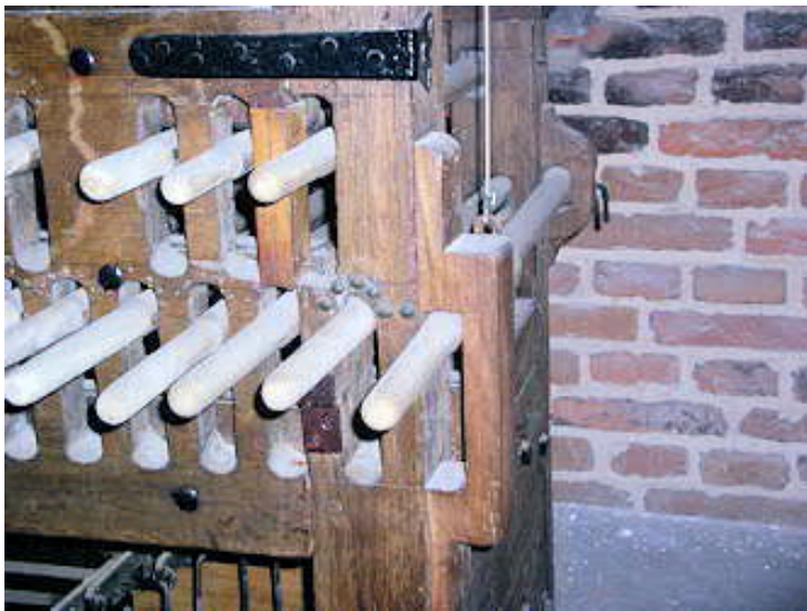
Detail van het Hemony-klavier in de Zuidertoren met aanpassingen uit 1699