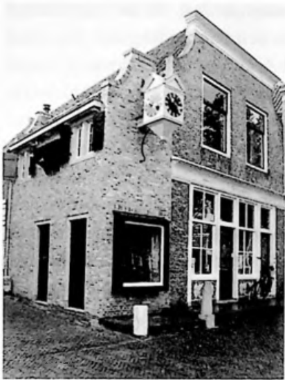
Zakkendragershuisje anno 2003

in oude glorie hersteld en werd de klok teruggeplaatst. Om het beeld te completeren is ook een bel opgehangen, die bij bijzondere gelegenheden wordt geluid.