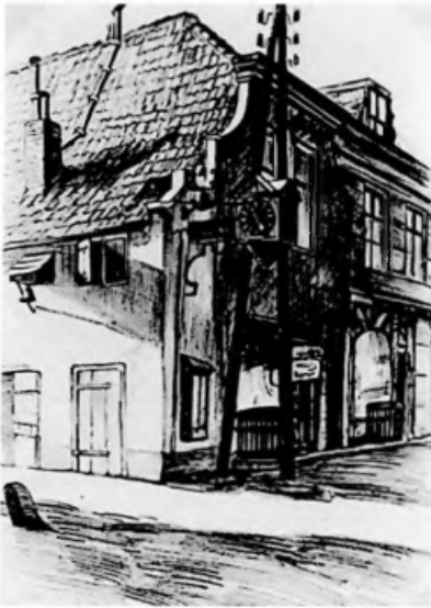
K. Zwolsman, ca 1940, tekening Streekarchief VPR, THA

Wanneer we het over het Maarlandse klokje hebben, bedoelen we daarmee het uurwerk. Maar sedert omstreeks 1800 hing naast het uurwerk nóg een klok, beter gezegd een bel. Over het doel van deze bel zijn de meningen nu, anno 2003, verdeeld. Een mening is, dat de