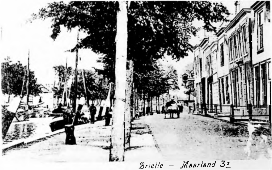
Maarland ZZ omstreeks 1920