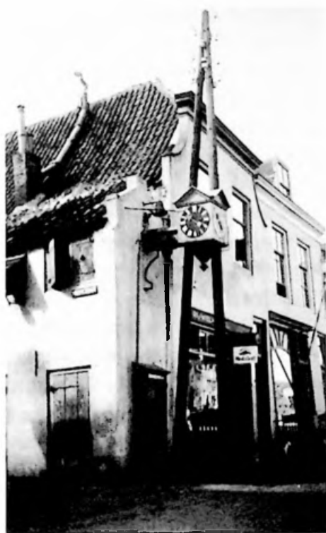
Het klokje anno circa 1920

Het Maarlandse klokje intrigeert velen. Toch is er niet veel van bekend. Bij studie naar het uurwerk en de klokken in de Catharijnekerk stuitte de onderzoeker op interessante informatie.