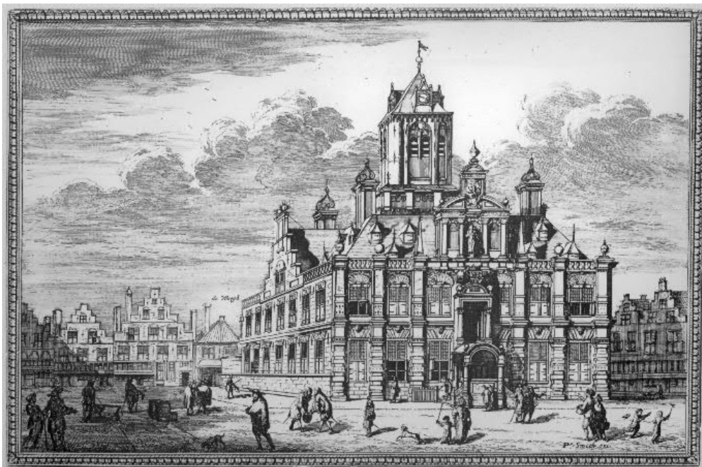
Het Stadhuis aan de Markt in Delft, naar Van Bleyswijck 1678

In 1618 werd het stadhuis opnieuw door brand getroffen; de toren bleef ook deze keer gespaard. Het stadhuis werd daarop herbouwd naar plannen van Hendrick de Keyser. Al in 1660 begon men aan een restauratie, die tot 1664 duurde en waarbij men ook de toren betrok. Bij verbouwingen in de 19e en 20e eeuw werd vooral het inwendige van het Stadhuis sterk gewijzigd. Tijdens de in 1982 voltooide restauratie is zoveel mogelijk de 17e-eeuwse situatie gereconstrueerd.