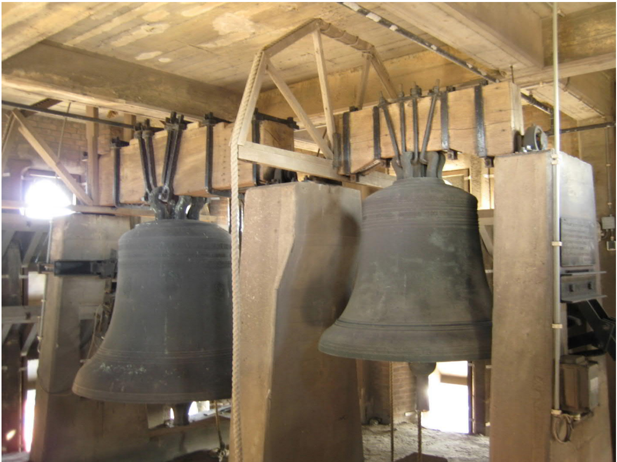
De twee luidklokken in het Stadhuis van Delft

Van de vier klokken, die Van Trier in 1570 had gegoten waren in 1808 nog twee exemplaren aanwezig. De diameters waren 126, respectievelijk 105 cm waaruit de gewichten werden geschat op 2500 en 1500 Amsterdamse ponden. 1 De stad verkocht in 1808 de grootste van deze twee klokken, de Sint Jacob; de andere, Maria, was tot 1943 in gebruik als slagklok bij het uurwerk. Zij werd in 1943 door de Duitse bezetter gevorderd en ging verloren. Eijsbouts goot in 1955 een replica aan de hand van eerder gemaakte gipsafdrukken. Deze klok hangt anno 2019 nog steeds in de toren, samen met de hieronder besproken klok.