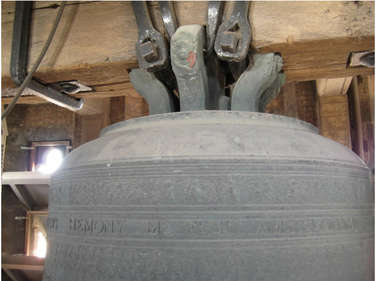
De Hemony klok uit 1659

betaling aan. De voormalige wachtklok schoof door naar de plaats van de uurklok. De Delftse uurwerkmaker Coenraad Harmensz Brouckman verzorgde de ophanging en herinrichting. De klok van Hemony meet 147 cm diameter en weegt 2000 kg. 2