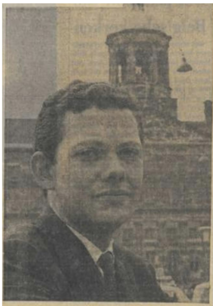
Trouw 19 juli 1963