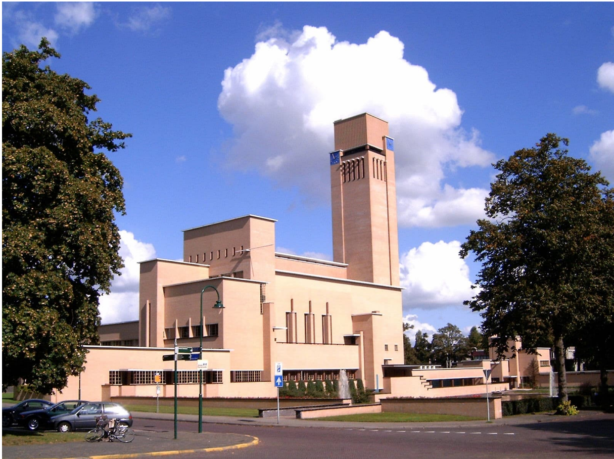
Hilversum, Raadhuis - Wikipedia