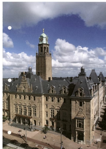
Stadhuis van Rotterdam